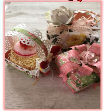
ペーパーボックス