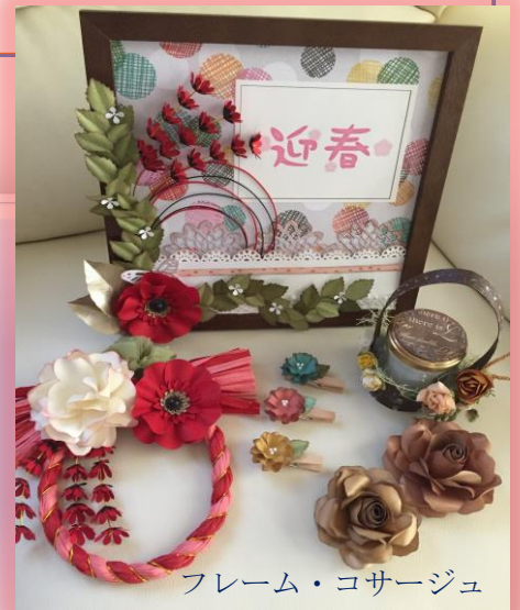
フレーム・コサージュ